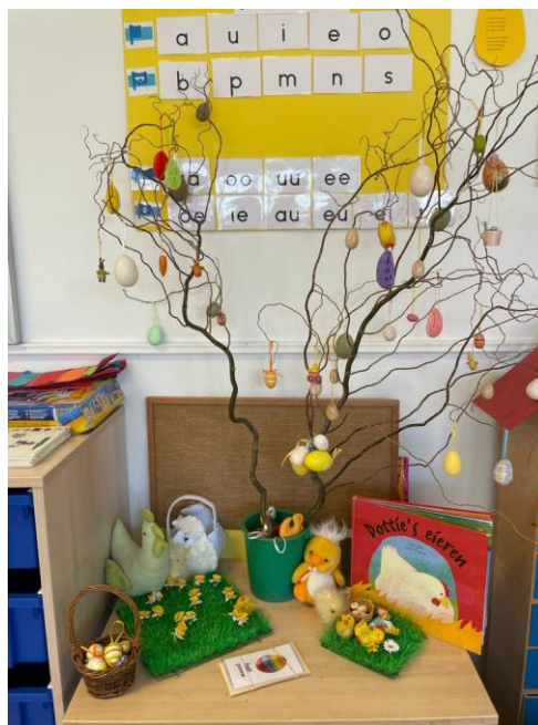
De Paastafel met Paastakken