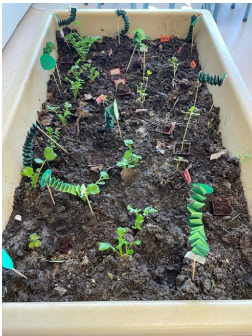
“Alles groeit” op het kleutergebouw

Meer foto's vindt u op het Ouderportaal.