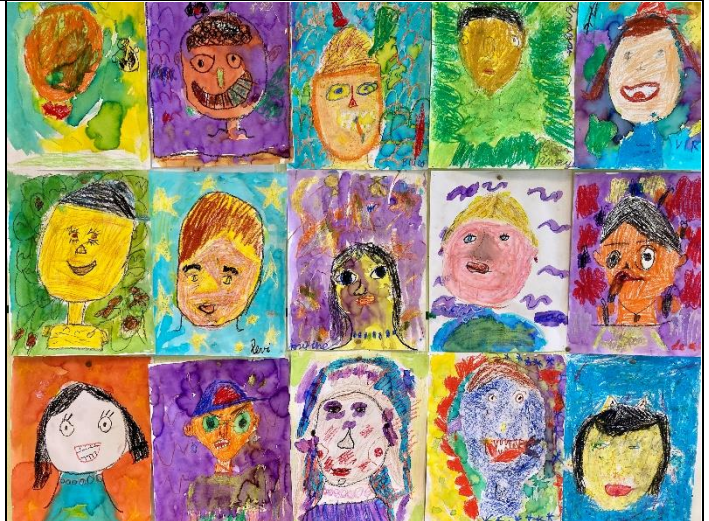
Zelfportretten van groep 4